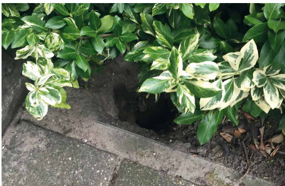
▲ Rattenhol onder bossage

Het bezuinigen op groenbeheer tijdens de crisis in combinatie met het 'teruggeven' van verantwoordelijkheden aan de burgers zijn een prima voedingsbodem gebleken voor het floreren van de rattenpopulatie. In Amsterdam is men om deze reden het project Stop de Rat begonnen ( www.stopderat.nl ), een educatief programma voor bewoners, want het rattenprobleem hangt samen met menselijk gedrag. De Vries: 'Doordat gemeenten de bossages in hun wijken lieten verwilderen tijdens de crisis, creëerden men onbedoeld kraamkamers voor ratten. Die bossages bieden hen bescherming tegen natuurlijke vijanden, zoals vogels en vossen. In de gemeente Rijswijk (Zuid-Holland) zijn wij gevraagd om samen met ondernemers en bewoners, die met hun klachten bij de gemeente aanklopten, de rattenplaag in bepaalde wijken aan te pakken. En dat is goed gelukt, vooral omdat de gemeente inzette op samenwerking tussen verschillende partijen. Naar mijn mening van groot belang voor het succesvol verlopen van ongediertebestrijding.'