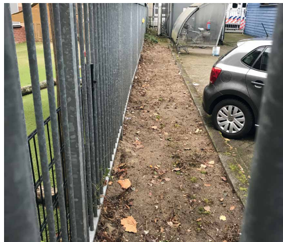
▲ Situatie Meer en Vaart ná

B ij ongediertebestrijding denken veel mensen aan het uitzetten van vallen en het verspreiden van gif. Voor de mensen van B2 Blue Pest Control zijn dit echter noodoplossingen. Ongedierte kan namelijk ook op veel andere, (milieu) vriendelijkere manieren worden bestreden.