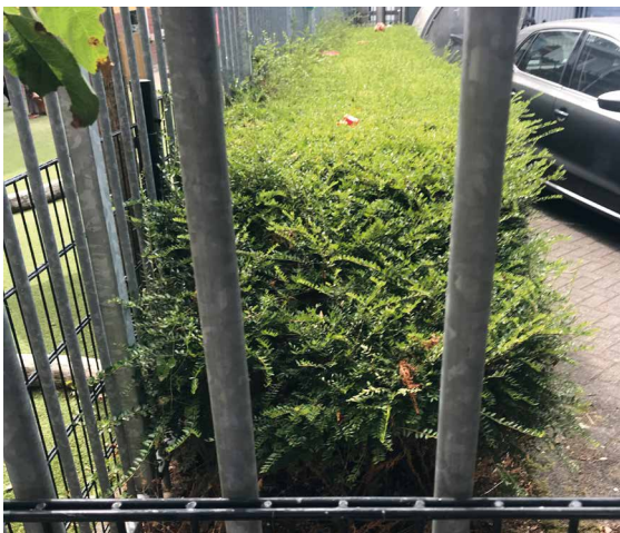
▲ Situatie Meer en Vaart vóór