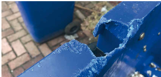
▲ Knaag schade